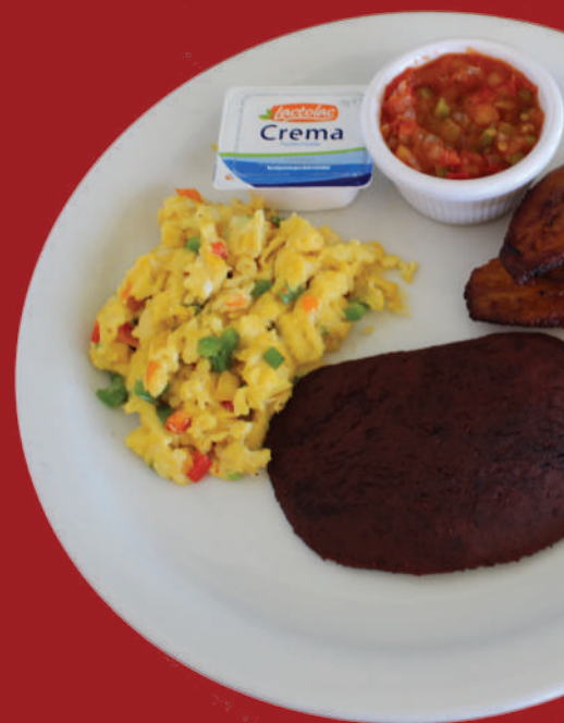
Desayuno de Omelette